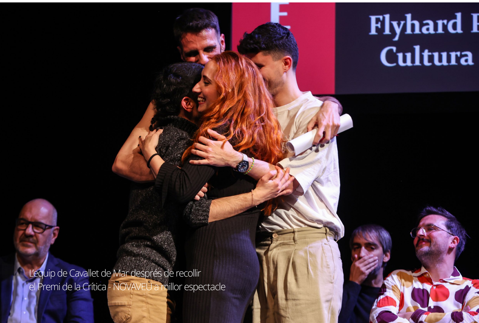
L'equip de Cavallet de Mar després de recollir el Premi de la Crítica - NOVAVEU a millor espectacle